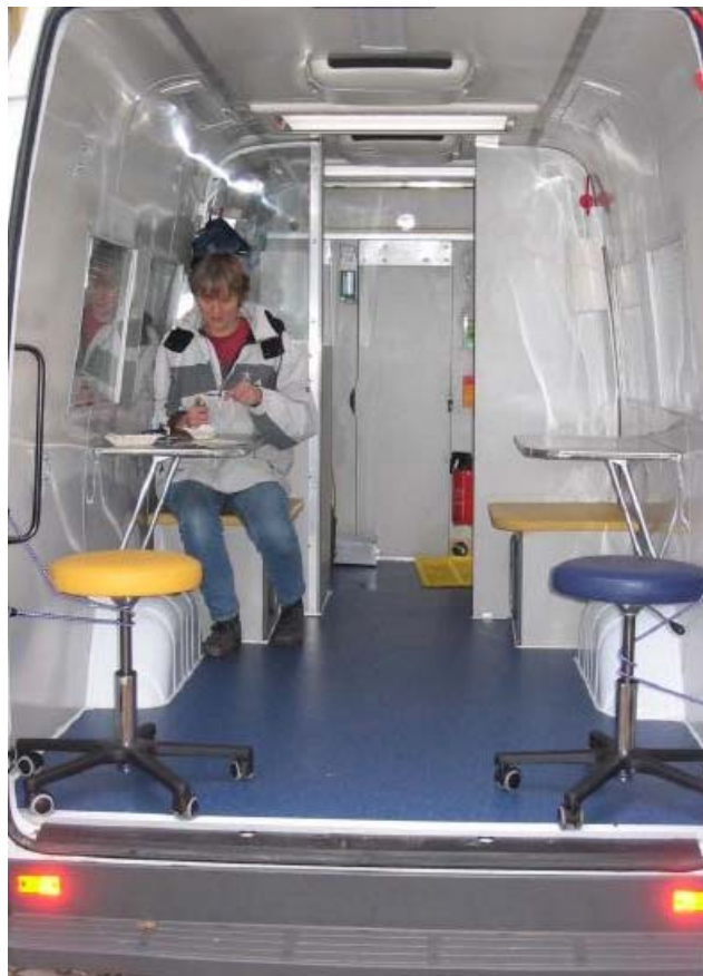
Fixpunkt Berlin Drogenkonsummobil